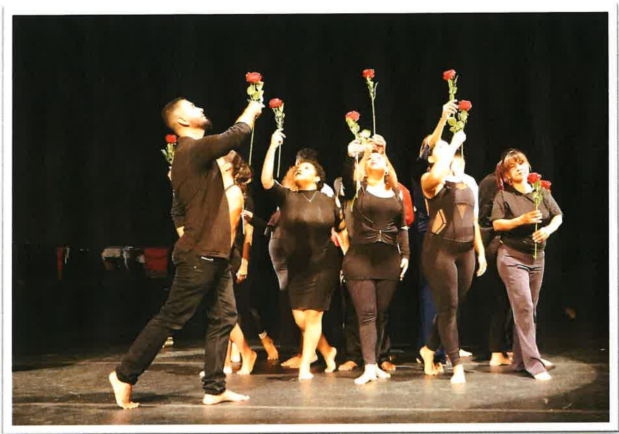
Foto: Internationale Dag van de Dans 29 april 2021 Aruba