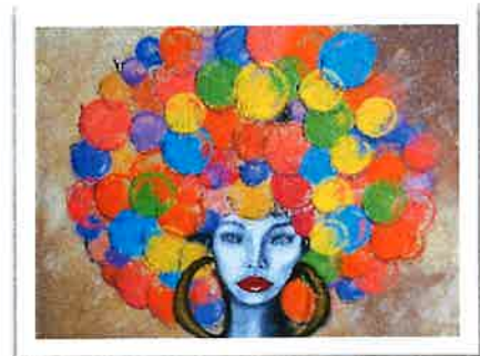
Tabel 2 'Seyo Nacional pa Artesania di Aruba'